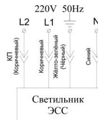
Светильник с аварийным режимом L1 - основное питание L2 - контроль присутствия U (подключать от эл. сети 220В фаза)